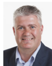
Af Steen Vindum